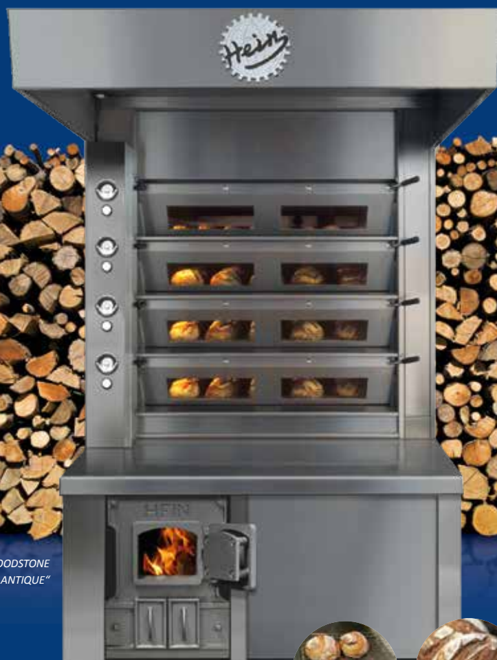
HEIN UNIVERSAL WOODSTONE exécution „ANTIQUE“

LA SIMPLICITÉ EST LE PLUS HAUT NIVEAU DE LA PERFECTION